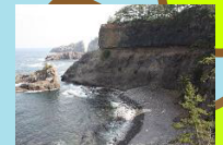
川に溶岩が流れた場所 境目がくっきり見える!